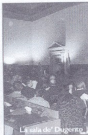
La sala de' Dugento